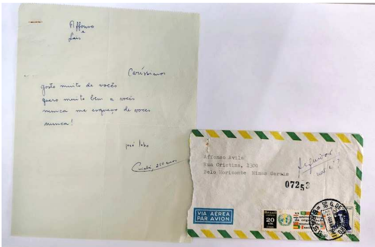
Figura 3 - Carta de José Lobo ao casal, contendo anotações manuscritas de Laís

Legenda: Anotação no envelope, com a caligrafia de Laís: “Arquivar, não é?”