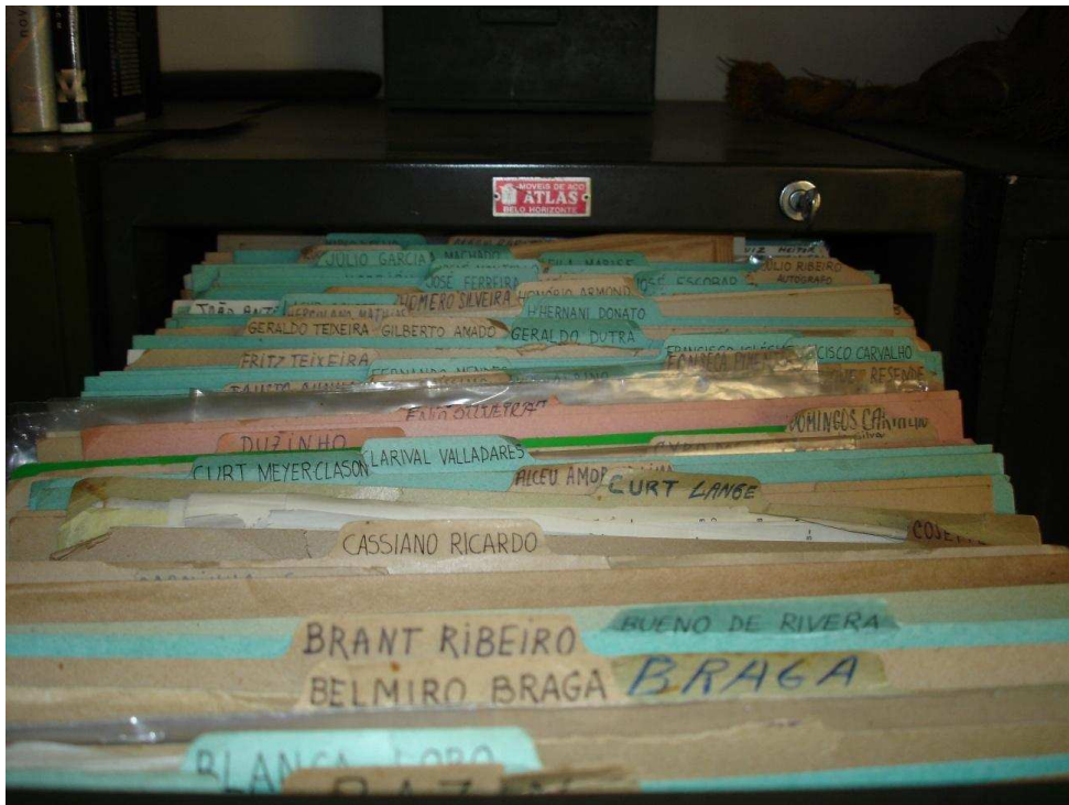
Figura 2 - Detalhe da organização interna da gaveta de correspondência