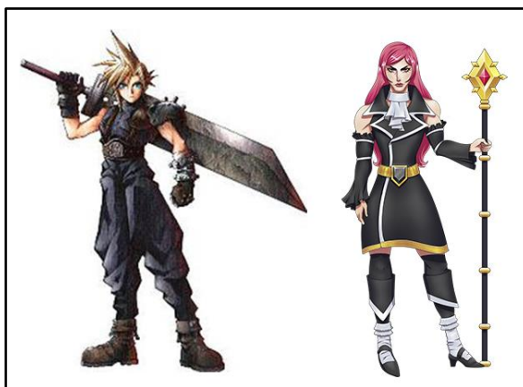
Figura 5 – Personagem Cloud do jogo Final Fantasy VII ao lado esquerdo e Yuki ao lado direito.