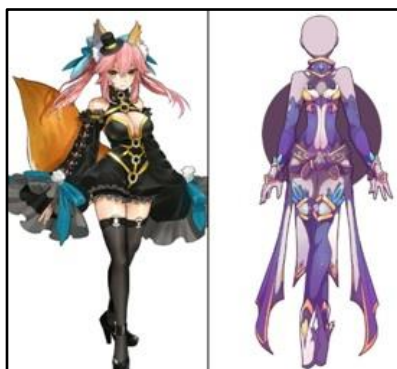
Figura 2 – Painel com roupas de personagens mulheres