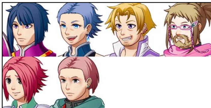
Figura 4 – Painel com alguns dos personagens não jogáveis do game Yuki's Tale . Nomes da esquerda para direita e por linha: Ferreira Romania, Bob Stone, Celestial Magnólia, Celestial Varus, Lady Ana, Lady Luna