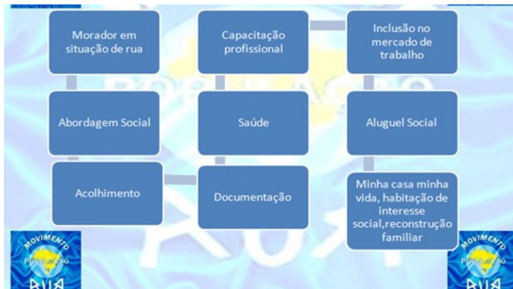
Imagem: Intersetorialidade.

Observe que para falar da intersetorialidade das políticas públicas, Lúcia propunha, com o MNPR, as etapas necessárias para chegar na Política de Moradia. Antes da moradia, acolhimento, mas a moradia como a saída: