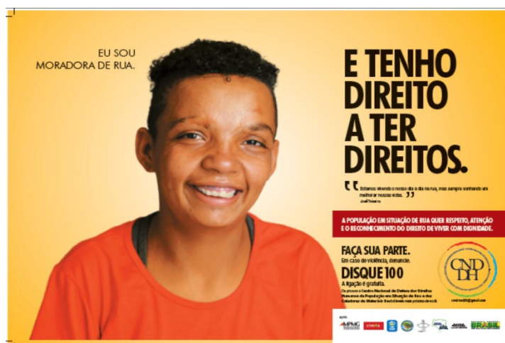
Campanha Direito a Ter Direitos.

“Se as pernas não andam, é preciso ter asas para voar” (Conceição Evaristo – Olhos D’água).