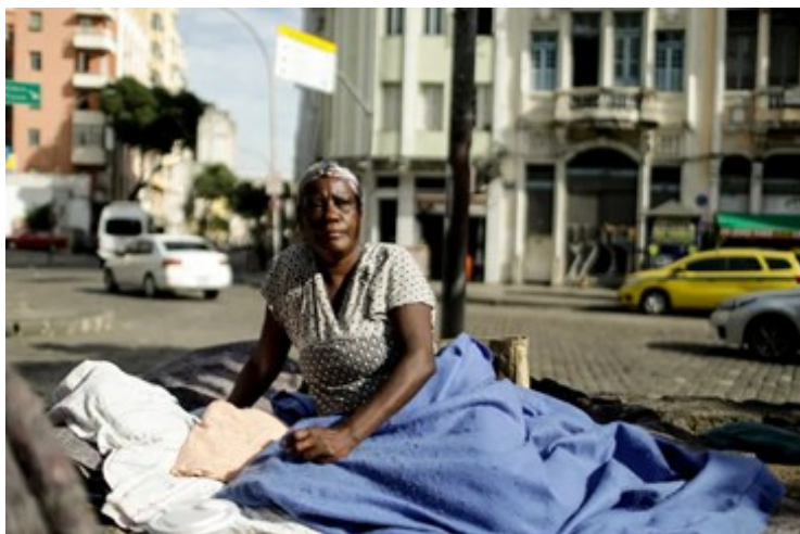
Imagem: mulher em situação de rua. 96

Quando um historiador contar corretamente as experiências das mulheres escravas ele ou ela terão feito um inestimável serviço. (Ângela Davis).