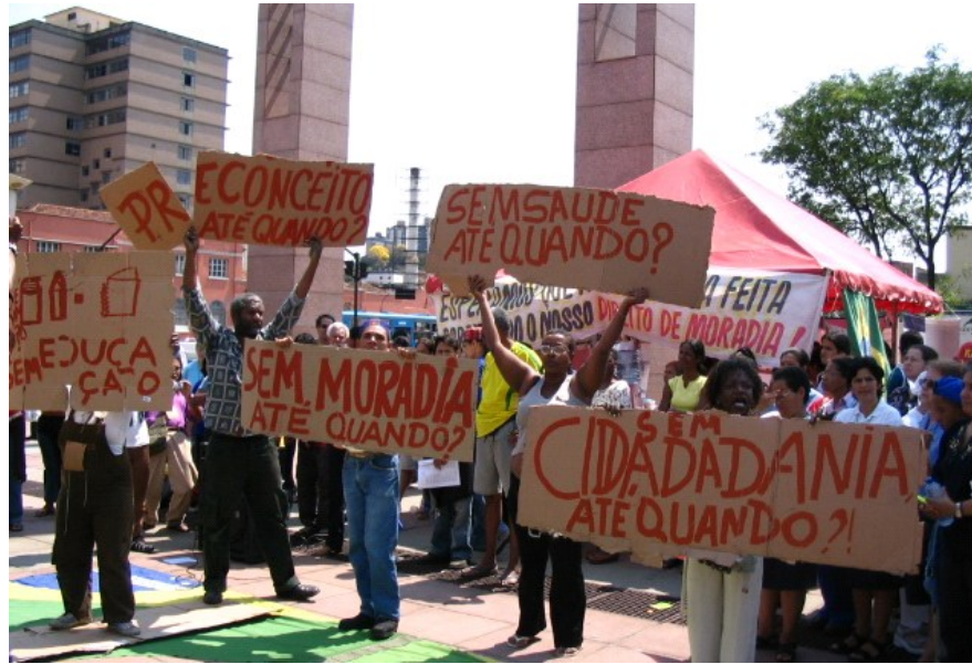
Imagem: Manifestação organizada pelo MNPR.

Parcerias foram se consolidando por meio de fóruns, de debates, de manifestações públicas, com presença de pessoas em situação de rua nos Conselhos de Assistência Social e de Monitoramentos em âmbito nacional, nos Estados e municípios do Brasil.