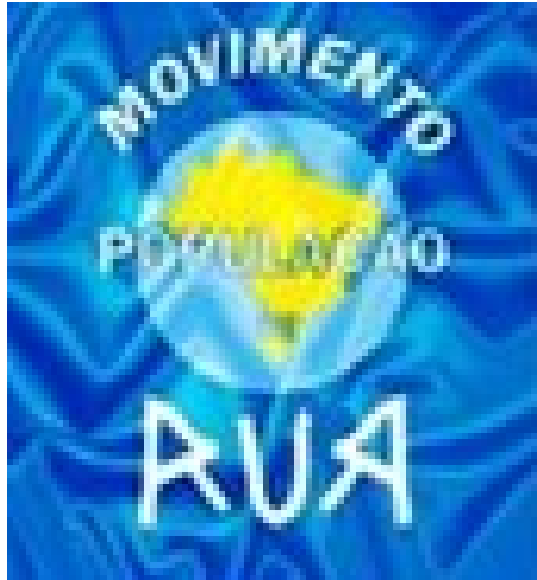
Imagens: Bandeira do MNPR.

Viver nas ruas retrata um cenário que é observado desde os tempos remotos. No contexto das cidades excludentes, aos tradicionalmente chamados de mendigos, loucos ou vagabundos, somam-se grande número de pessoas e famílias que são afetadas pelo déficit habitacional, processo de precarização das relações de trabalho e dificuldades de acesso a serviços públicos essenciais. Perdendo seus vínculos profissionais, afetivos e familiares, consequência dos processos de segregações e exclusões, característicos da modernidade, a saída que encontra é viver nas ruas, ficando à margem do direito à cidade.