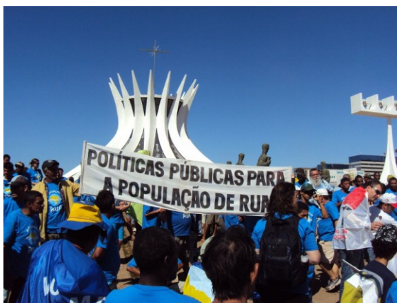
Imagem: Manifestação da População em Situação de Rua em Brasília, por meio do MNPR 69

Sem políticas públicas que assegurem o pleno acesso a direitos fundamentais, como a moradia adequada, a saúde mental de mulheres, crianças, pessoas negras e empobrecidas continuará em risco.