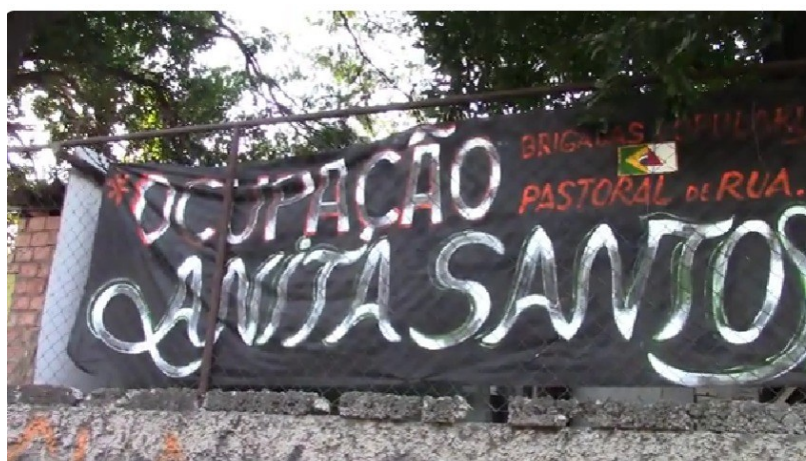
Imagem: Entrada da Ocupação Anita Santos.

A Ocupação Anita Santos, em Belo Horizonte, nasceu no dia 11 de junho de 2018 e está localizada na Avenida Tereza Cristina, nº 420, próximo ao Viaduto Itamar Franco, no bairro Carlos Prates, Estado de Minas Gerais. Foi organizada com pessoas em situação de rua na luta por moradia.