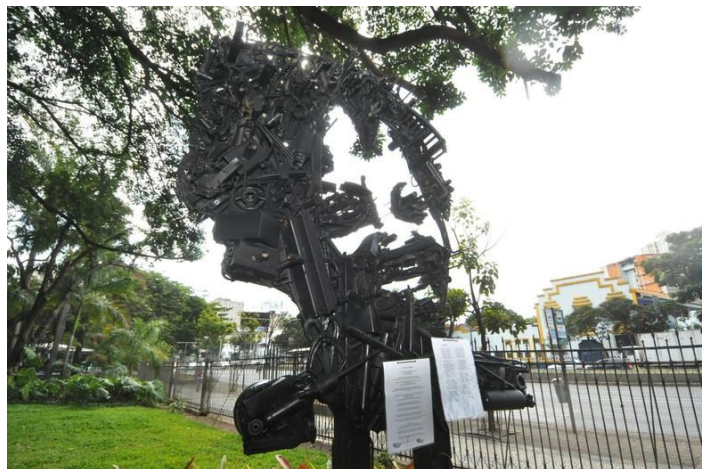
Escultura de Anita Gomes no Parque Municipal de Belo Horizonte, MG.

Samuel faz referência ao Parque Municipal de Belo Horizonte porque após a morte de Anita Santos foi feito uma escultura em sua homenagem nesse Parque. Abaixo, imagem da escultura com a expressão de seu rosto: