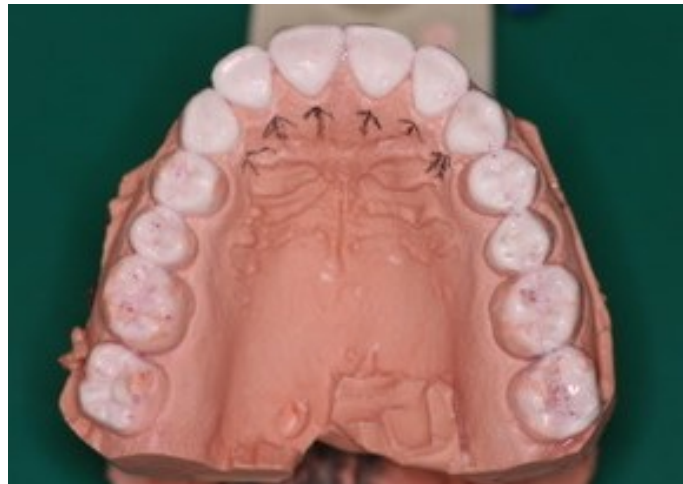
Figura 6- Enceramento diagnóstico da arcada superior.

Em seguida foi realizado enceramento diagnóstico, visando planejar e restabelecer anatomia, função e estética. Procedeu-se aos ajustes nos contatos oclusais de modo a conferir contatos a fim de se obter as guias de lateralidade e protrusão mutuamente protegidas. Além de otimizarem o ajuste oclusal, essas etapas aumentam a previsibilidade dos resultados estéticos e funcionais da reabilitação oral (Valente et al. , 2020) (FIGURA 6 e 7).