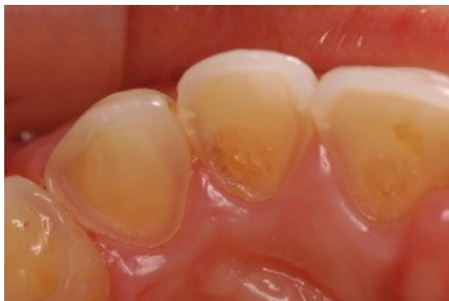
Figura 2- Vista palatina do incisivo lateral e canino superiores do lado direito.