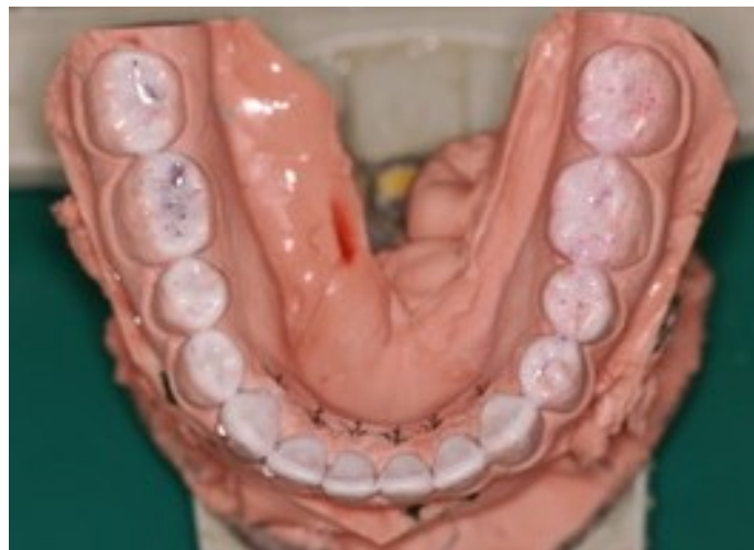
Figura 7-Enceramento diagnóstico da arcada inferior.