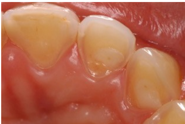
Figura 3- Vista palatina do incisivo lateral e canino superiores do lado esquerdo.