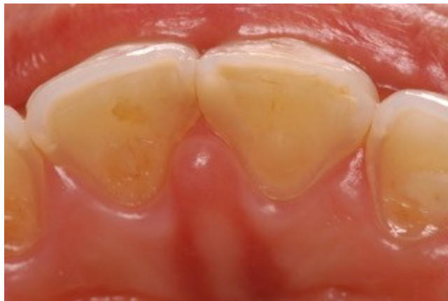
Figura 1- Vista palatina dos incisivos centrais superiores

Ao realizar o exame clínico intraoral, observou-se a presença de hiperplasia gengival na região palatina dos incisivos e caninos superiores, associada a lesões generalizadas compatíveis com erosão dentária (FIGURA 1,2 e 3).