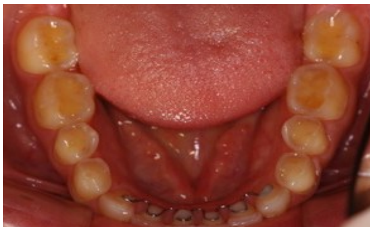
Figura 5- Vista oclusal da arcada inferior.