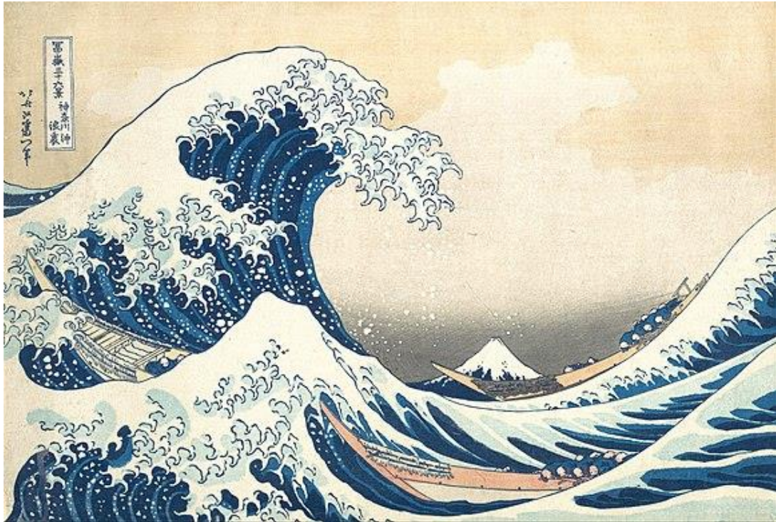
Figura 1 - O Vagalhão de Kanagawa de Katsushika Hokusai