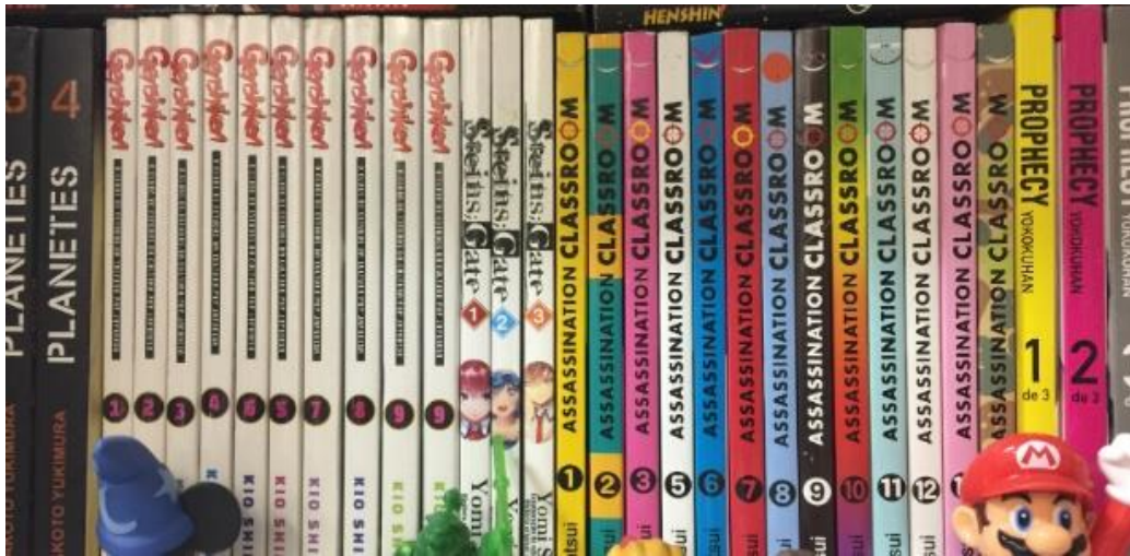
Figura 2 – Mangás no formato tankobon

Fonte: https://conteudo.imguol.com.br/c/entretenimento/4b/2017/01/26/manga-1485447009187_615x300.jpg Acesso em: 17 de julho de 2022