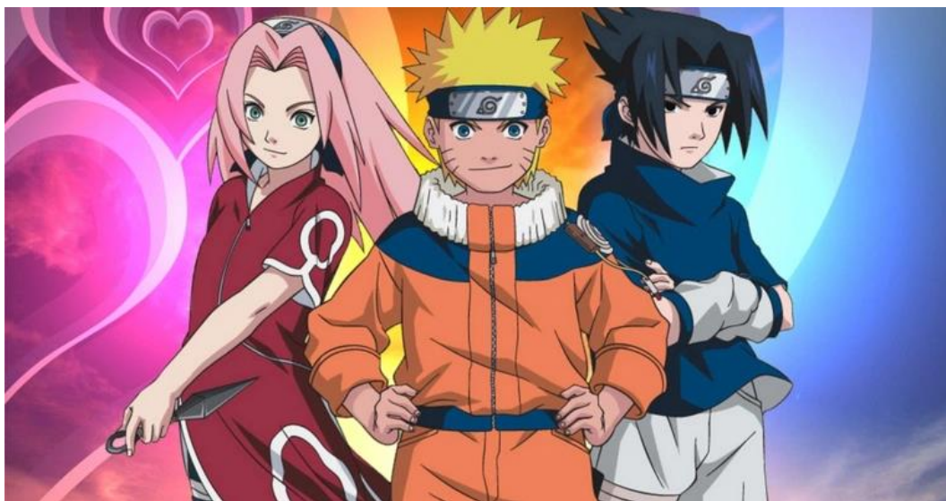
Figura 4 – Anime Naruto