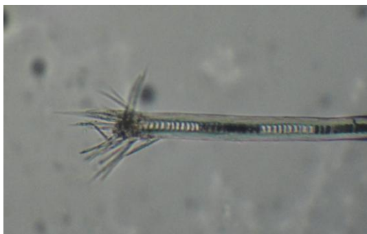
FIGURA 4. Observa-se pelo quebradiço à tricografia com borda em escova.