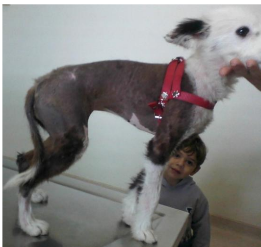
FIGURA 3. Cadela border collie portadora de NHC. Observa-se alopecia no tórax e abdômen, presença de pelame normal nas extremidades, bem como proporcionalidade corpórea, apesar de tamanho reduzido.

com a idade sem evidência de crescimento desproporcional dos membros, estado geral bom, mucosas normocoradas, tempo de preenchimento capilar menor que 2 segundos, turgor cutâneo adequado e linfonodos palpáveis não reativos. Palpação abdominal sem alterações. As alterações dermatológicas observadas foram: alopecia generalizada em face dorsal e ventral de tórax e abdômen, cauda e pescoço, poupando cabeça e membros, pele hiperpigmentada e ressecada, sem lesões aparentes (FIG. 3).