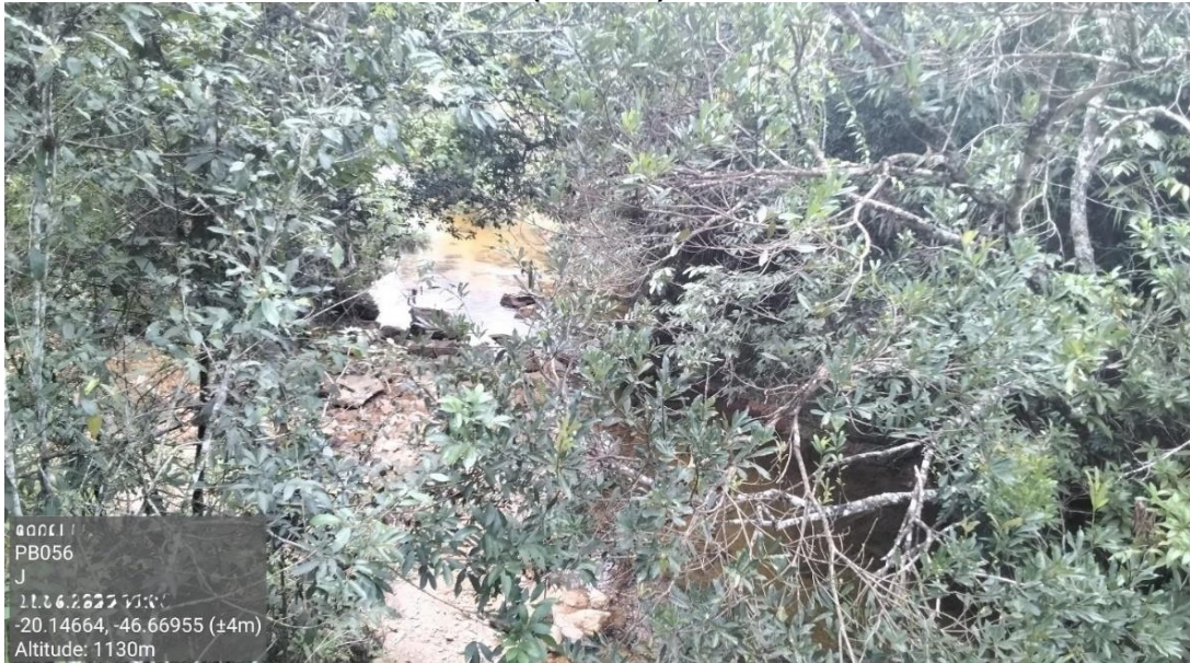
Figura 1: Local do ponto de amostragem (Ponto 1) à Jusante da Bacia do Rio Paraíba (PB056 J)