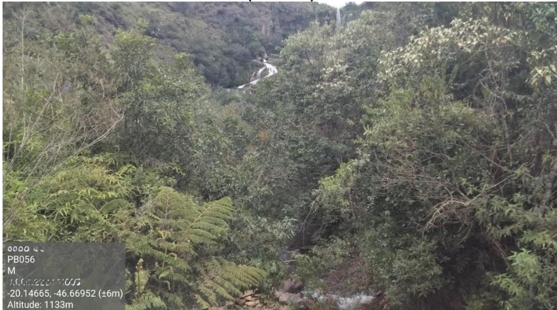
Figura 3: Local do ponto de amostragem à Montante (Ponto 03) da Bacia do Rio Parabaíba (PB056 M)

do manancial, essencial para a manutenção da vazão e da qualidade da água ao longo do rio. A vegetação nativa presente contribui para a estabilidade do solo, a infiltração da água e a proteção contra processos erosivos, reforçando a importância da preservação das nascentes para a sustentabilidade dos recursos hídricos da bacia.