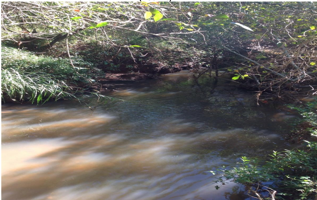
Figura 5: Local de amostragem do ponto à Jusante (Ponto 1) da Bacia do Rio Grande (BG071 J)