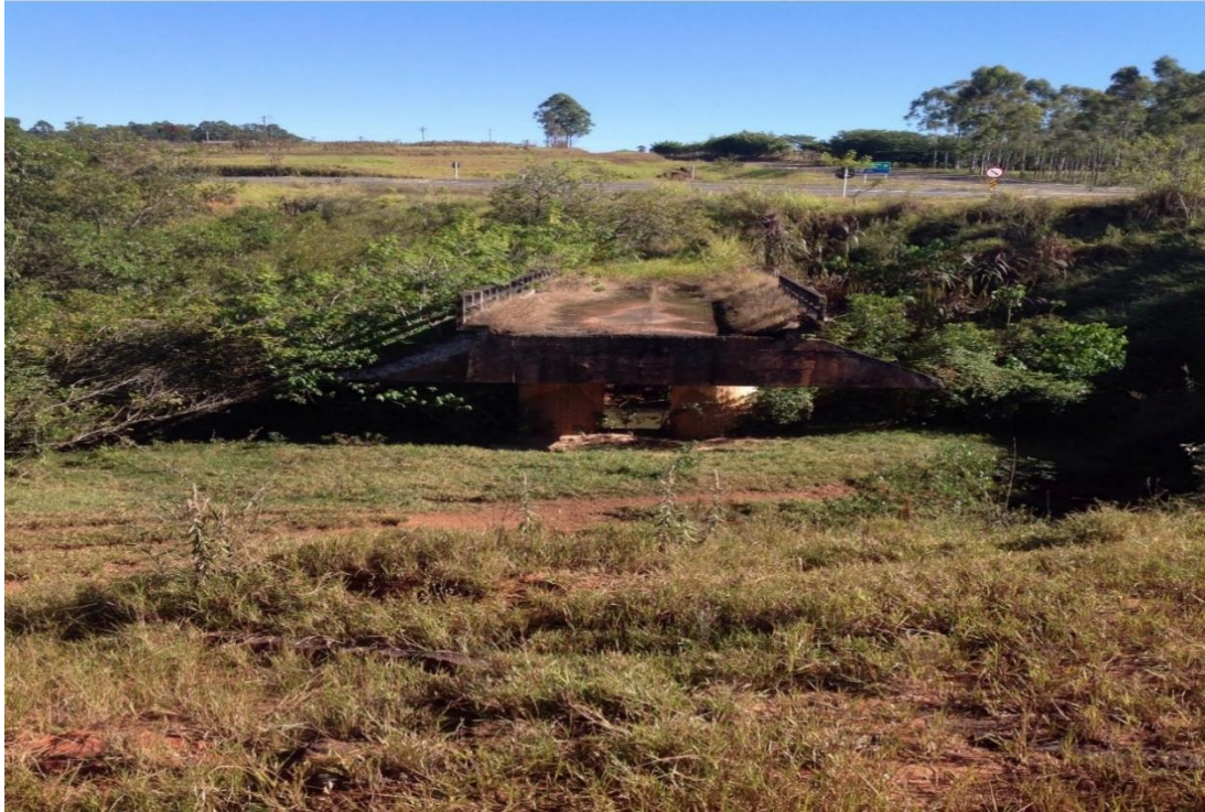
Figura 6. Local de amostragem do Ponto 2, situado entre os pontos à jusante e à montante da da Bacia do Rio Grande (BG071)