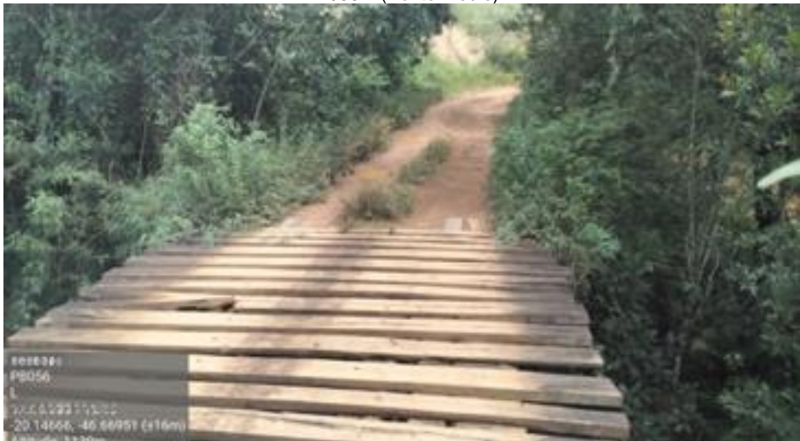
Figura 2: Local de amostragem do Ponto 2, situado entre os pontos à jusante e à montante da PB056 L (Ponto médio)

Na Figura 2 é mostrado o segundo ponto de amostragem, o Ponto médio (Ponto 2), situado entre os pontos à jusante e à montante da PB056 L, sob a ponte de madeira situada em uma estrada de terra.