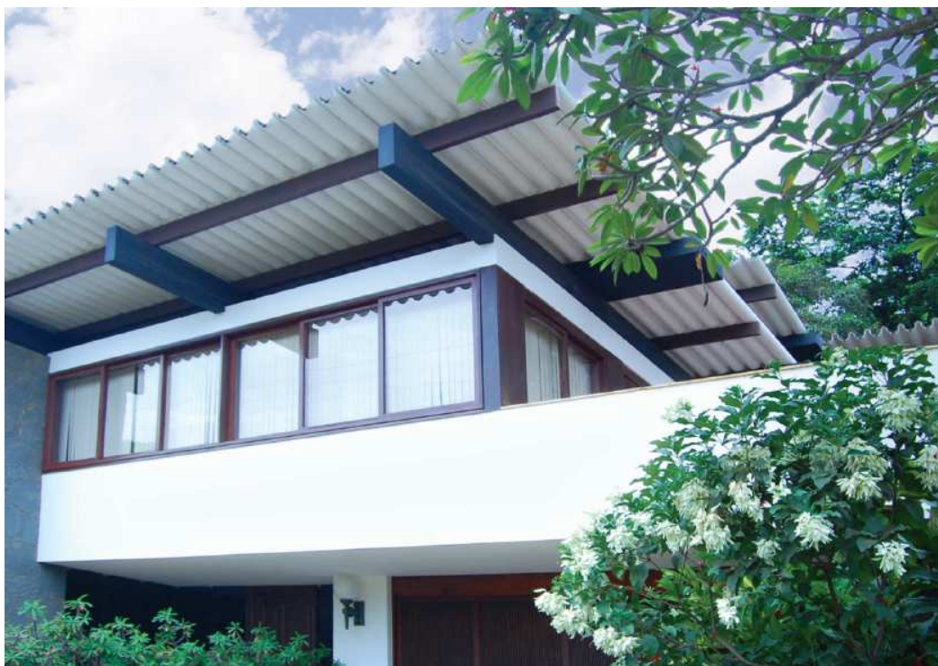
Residência ampliada por Luzimar Góes Telles e Flávio Almada