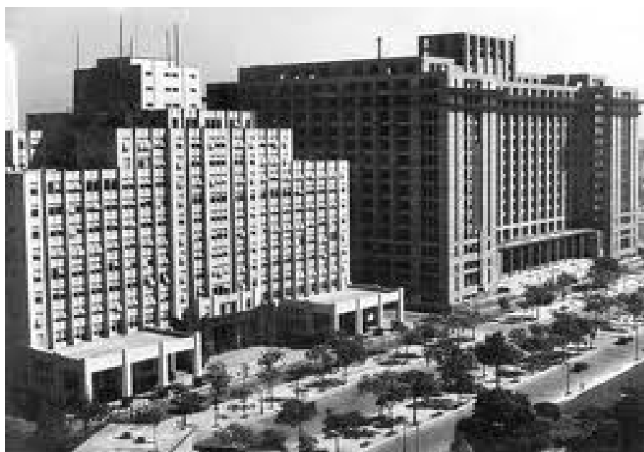
Figura 2: Ministérios do Trabalho e da Fazenda

Paralelo ao concurso do MES, os modernistas concorreram com projetos para outras duas edificações do governo de Getúlio Vargas: os ministérios da Fazenda e do Trabalho, que podem ser vistos na figura 2, sendo o primeiro à direita e o segundo á esquerda. O concurso do ministério da fazenda se iniciou em 1936 e teve como desfecho a vitória a arquitetura de tendência moderna revolucionária , de autoria de Alves de Souza e Enéas Silva 23 (CAVALCANTI, 2006).