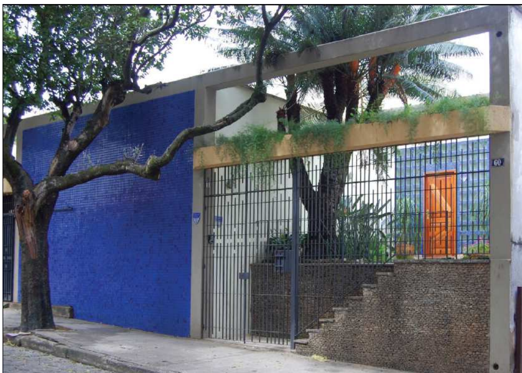
Projeto de Francisco Bolonha (1948)