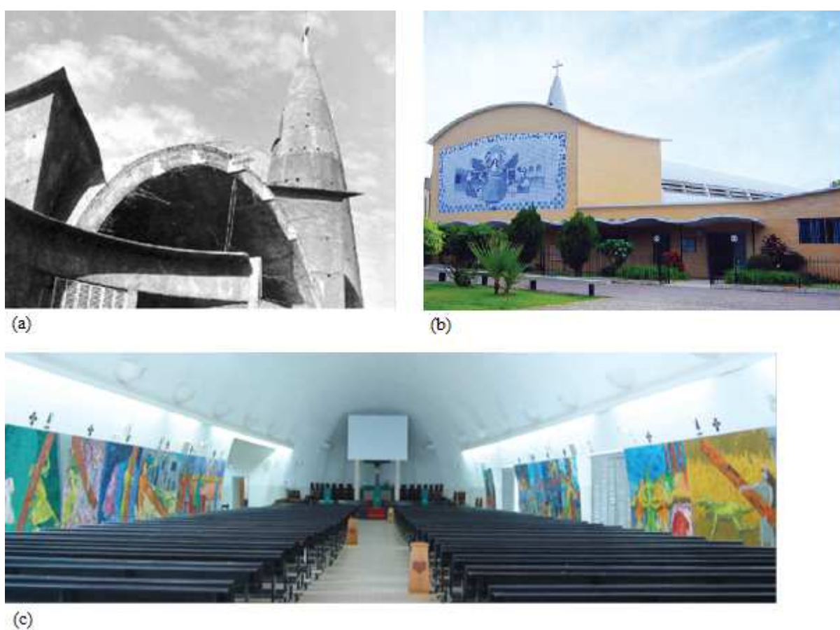
Figura 12: Matriz de Santa Rita de Cássia