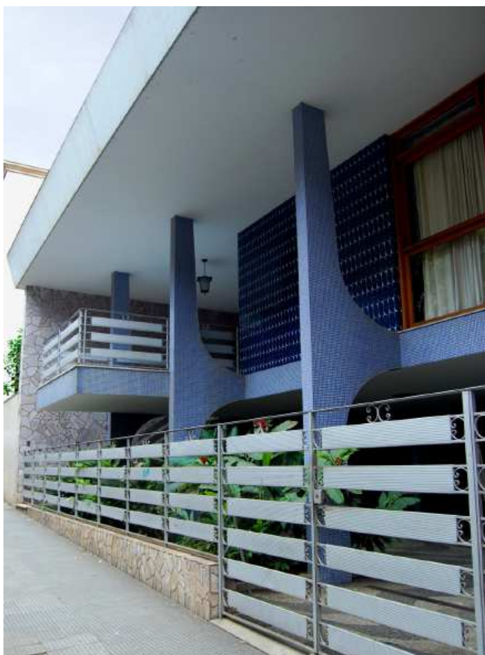
Projeto de Fernando de Oliveira Graça (1967)