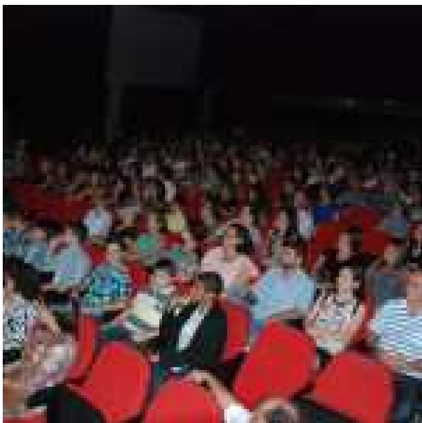
Figura 30: Pré-estreia do filme Meu pé de laranja lima