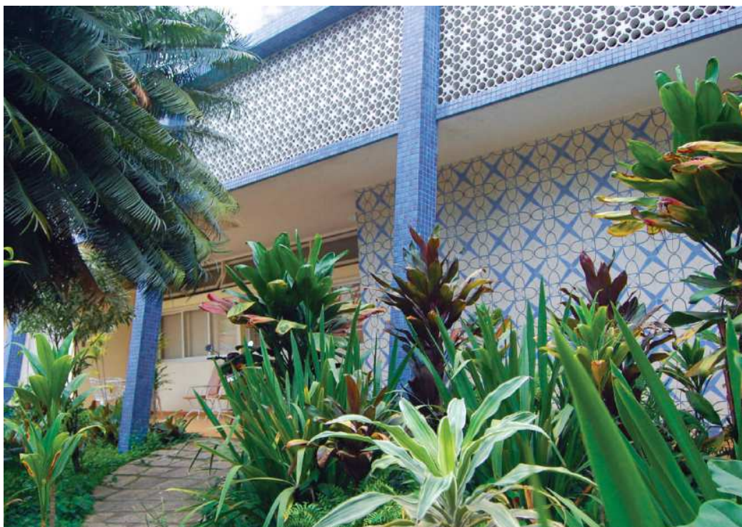
Projeto de Luzimar Góes Telles (1953)