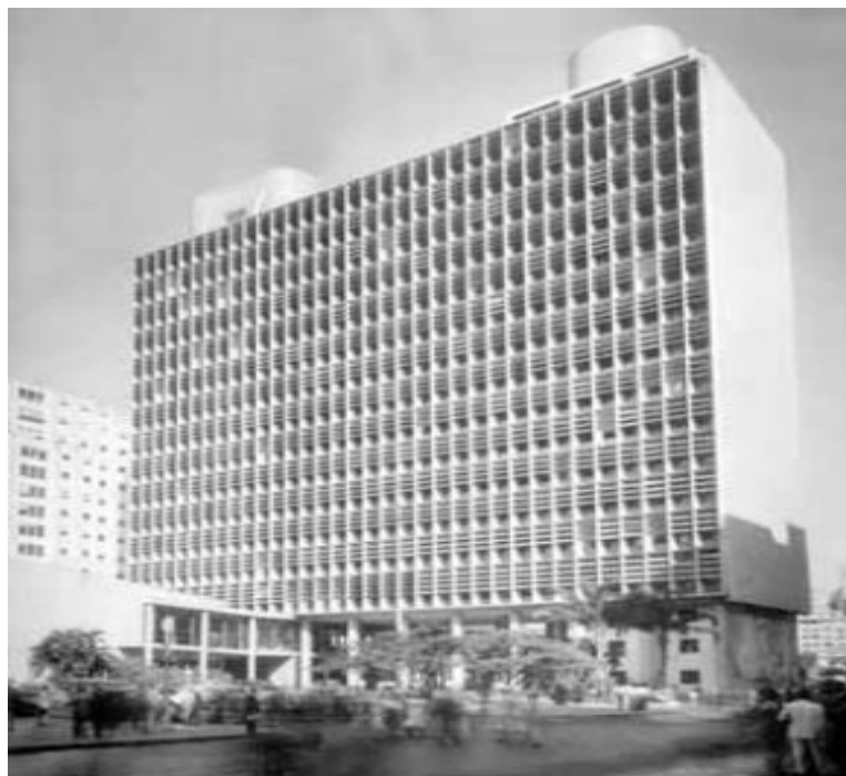
Figura 1: Ministério da Educação e Saúde (MES)

Em complemento às negociações políticas que envolviam a incorporação da arquitetura modernista no projeto político-ideológico do Estado Novo, outro aspecto legitimador foi a inserção de Le Corbusier ao grupo de arquitetos que pensariam as edificações do poder público brasileiro, particularmente da equipe que trabalharia no projeto do MES – donde se destaca Oscar Niemeyer. Le Corbusier reforçaria o caráter qualitativo da arquitetura modernista, em disputa com os acadêmicos neocoloniais. Para o arquiteto francês, a inserção no mercado brasileiro era de grande interesse, uma vez que na França este era conhecido mais por seus livros que por suas obras, e não encontrava espaço para seus projetos devido à forte recessão financeira ainda decorrente da primeira Grande Guerra e pelo predomínio das Escolas de Belas Artes na arquitetura francesa (CAVALCANTI, 2006).