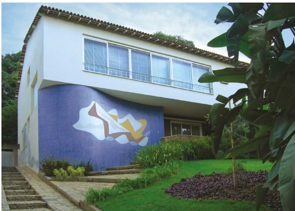
Projeto de Edgar Guimarães do Valle; Jardins de Burle Marx; Painel de Paulo Werneck (1948)