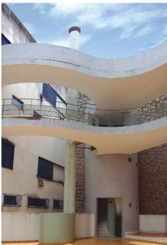
Edifício A Nacional – passarelas ligando os dois blocos residenciais (b)