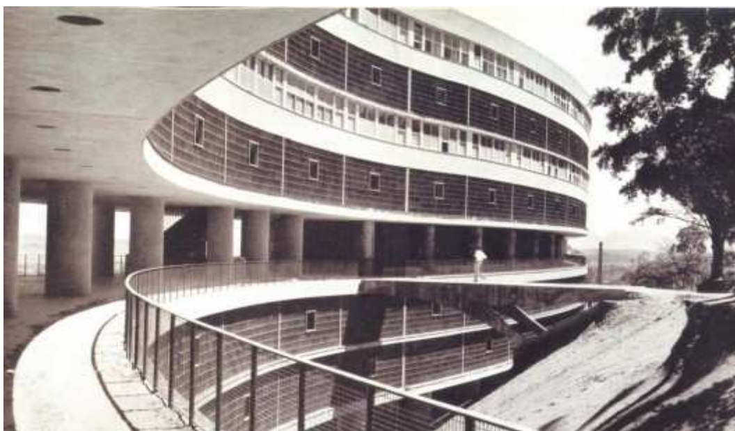
Figura 4: Conjunto do Pedregulho

cargo de Affonso Reidy, contemplava 272 apartamentos, projetados a partir de dados levantados com base nos hábitos de 570 famílias cadastradas. A princípio, este levantamento serviria para reduzir o hiato entre a concepção e o uso do objeto arquitetônico. Entretanto, a distância entre a data do cadastramento e a distribuição dos imóveis, provocada pelas constantes mudanças no projeto implicou não apenas uma defasagem dos dados levantados, mas também a redistribuição dos imóveis em desacordo com o perfil traçado no cadastramento, prevalecendo então decisões políticas e protecionistas.