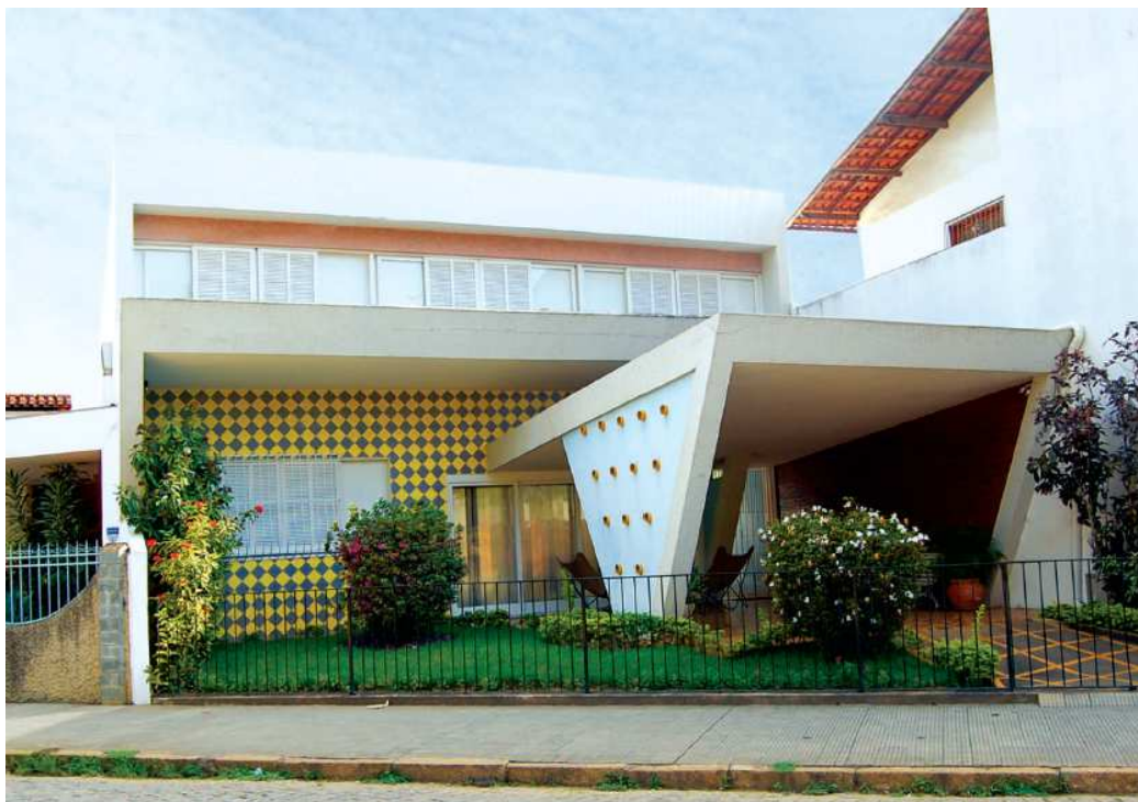
Projeto de Luzimar Góes Telles (1955)