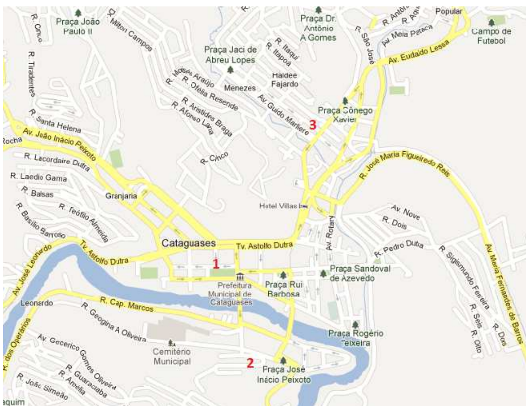
Figura 5: Mapa de Cataguases.