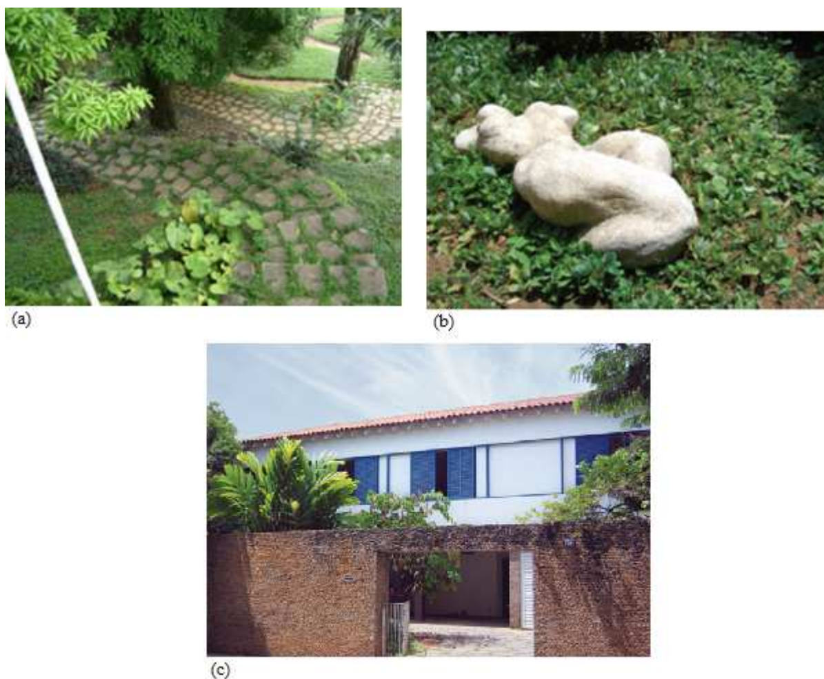
Figura 8: Residência Francisco Inácio Peixoto