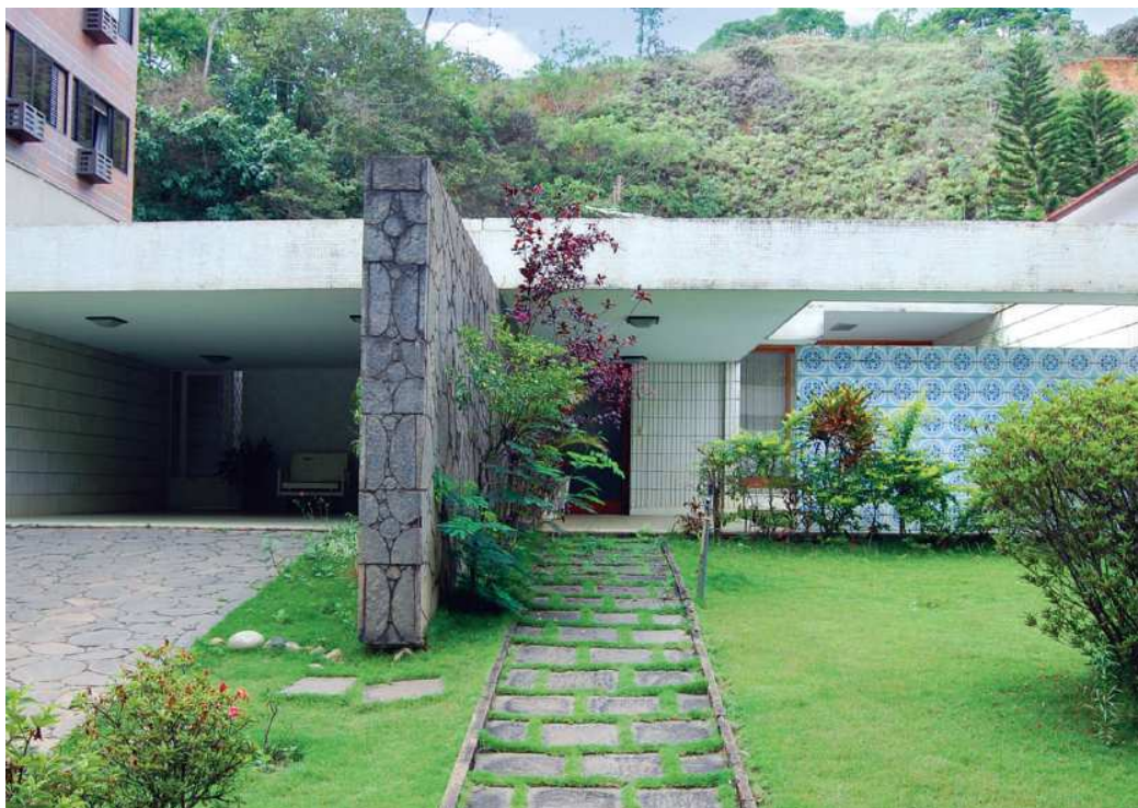
Projeto de Luzimar Góes Telles (1964)