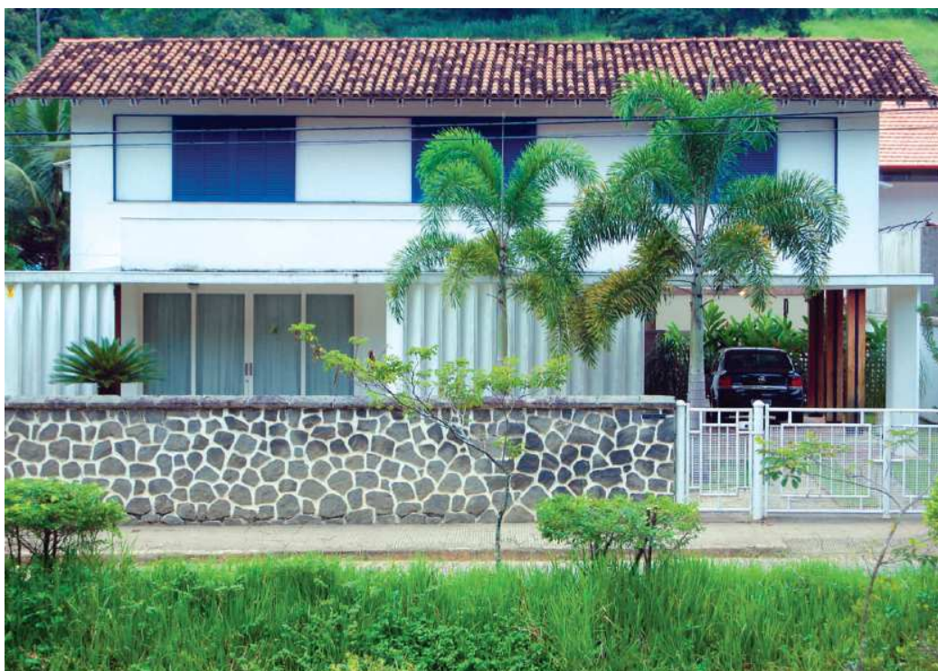
Projeto de Luzimar Góes Telles (1952)