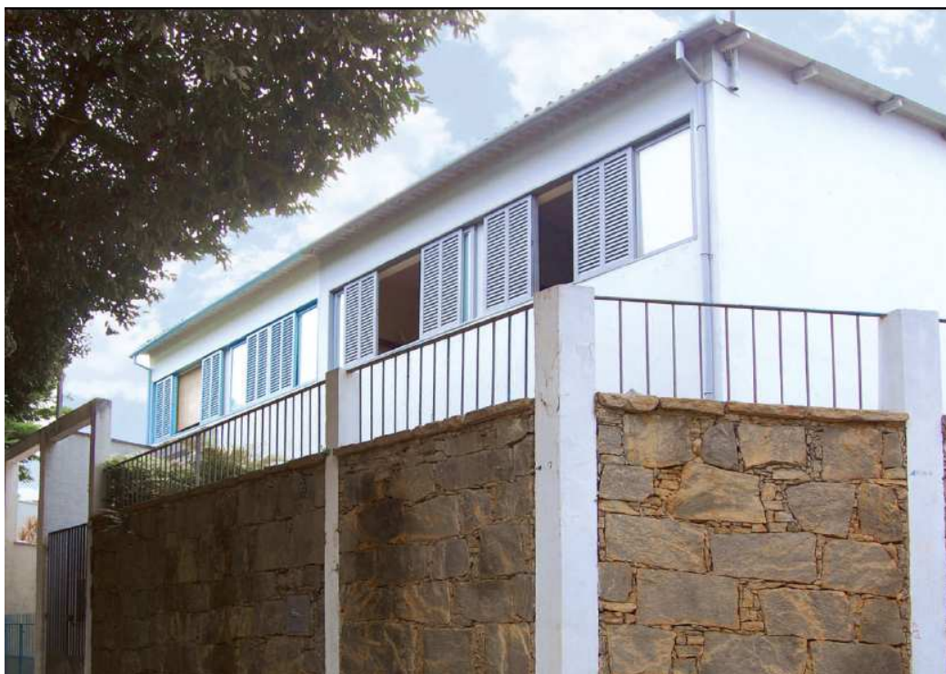
Figura 17: Residência Cia Industrial