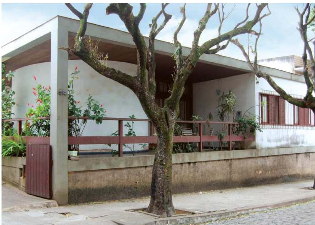
Projeto de Francisco Bolonha (1948)