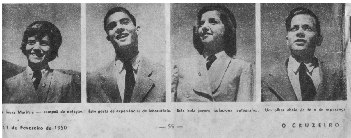
Figura 14: Alunado do Colégio de Cataguases